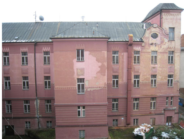
12. Dvorová fasáda J krídla.