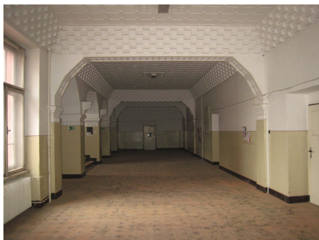
52. 2.n.p., schodisková hala, J pohľad.