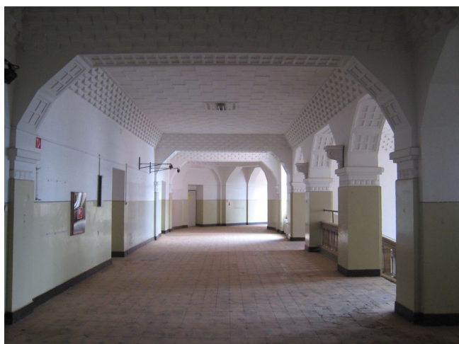
61. 3.n.p., schodisková hala, čelné křídlo, S pohľad.