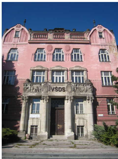
4. Čelná fasáda, detail.