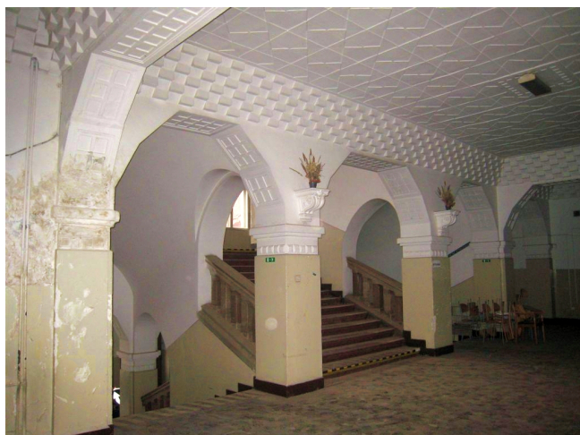
43. 1.n.p., schodisko vo vstupnom vestibule, m.č.1.02.