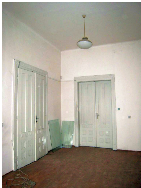
37. 1.n.p., J krídlo, m.č.1.33, detail s pôvodnými dverami.