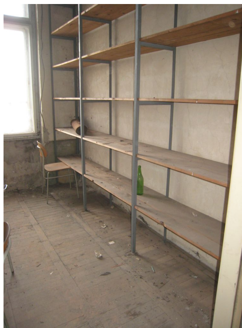
71. 4.n.p., miestnosť býv. archívu.