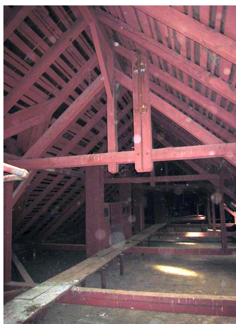
72. Podkrovie nad J krídlom, Z pohľad.