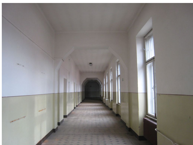
68. 3.n.p., chodba v S krídle, Z pohľad.