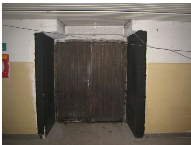
17. Vstup z dvora, J krídlo.