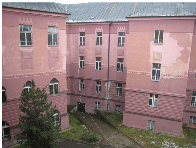
11. Dvorová fasáda J krídla hlavnej budovy, V časť.