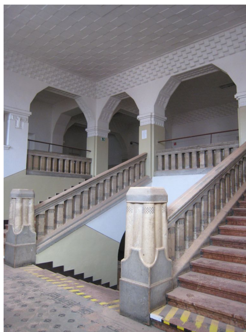
60. Schodisková hala, pohľad z JZ do čelného křídla.