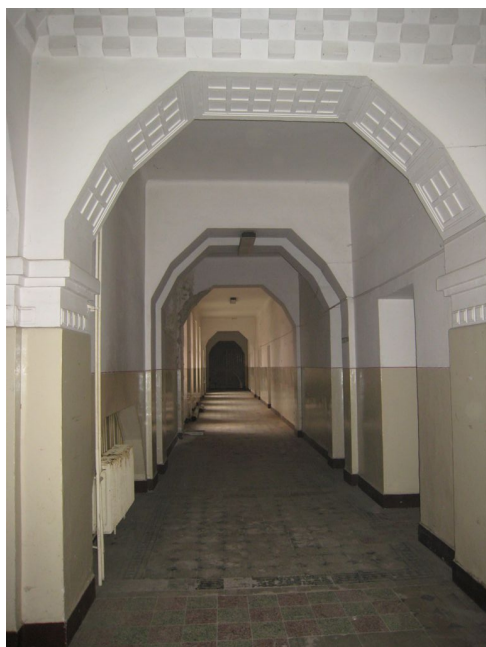
32. 1.n.p., chodba v S krídle, V pohľad.