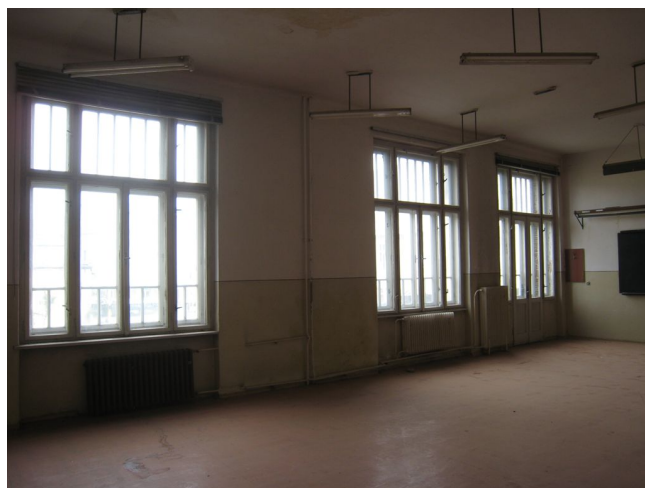
53. 2.n.p., m.č.2.13.