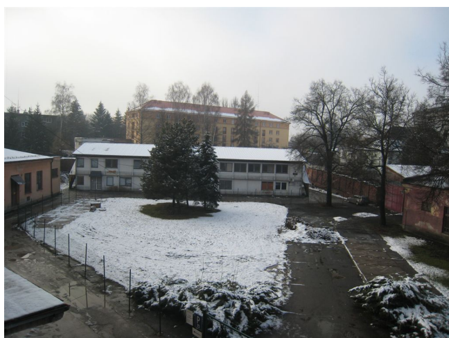
14. Nádvorie, Z pohľad.