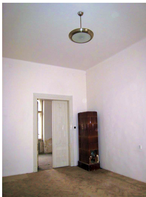
41. 1.n.p., J krídlo, m.č.1.44.