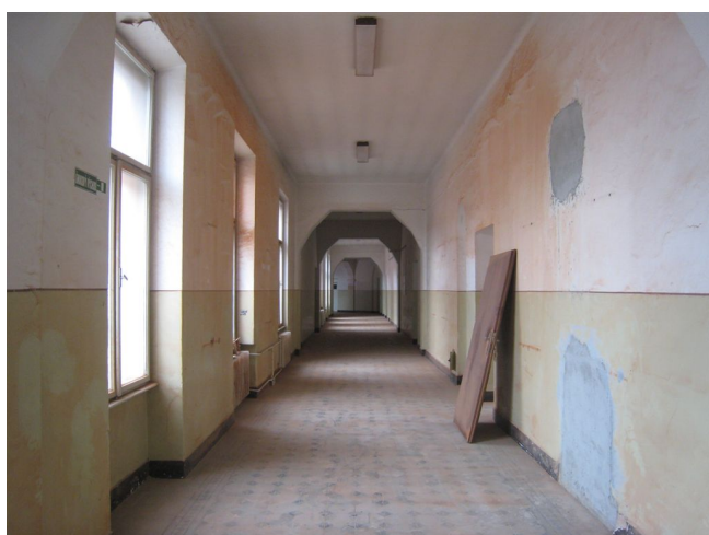
63. 3.n.p., chodba v J křídle, Z pohľad.