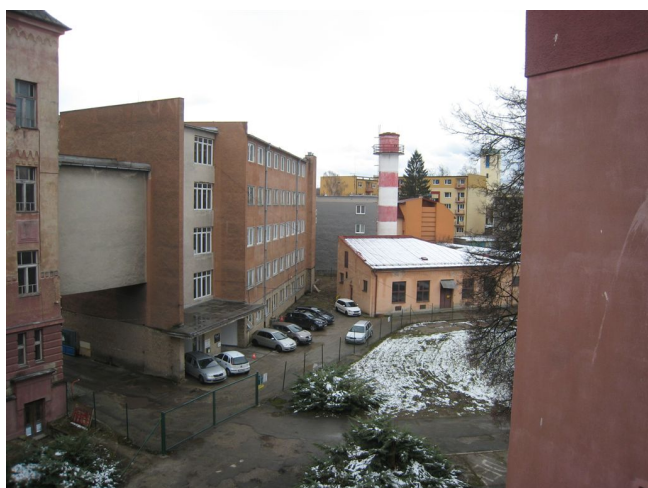
13. Dvor, JZ pohľad.