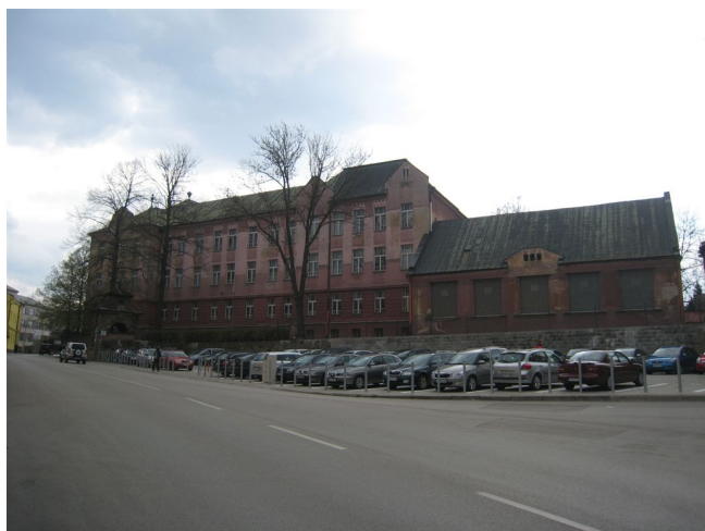
2. Fasády do ulice J.M. Hurbana, S pohľad.