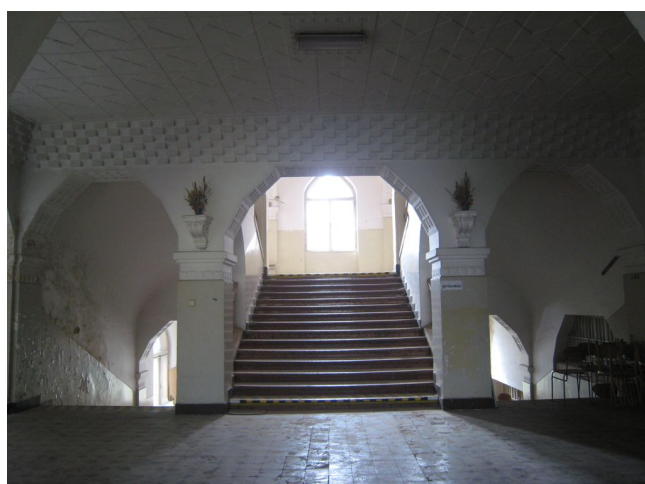
30. 1.n.p., vstupný vestibul so schodiskom, m.č.1.02.