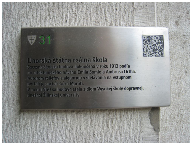
76. Informačná tabuľka.