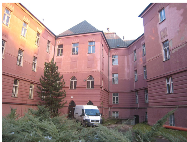
10. Dvorová fasáda čelného krídla hlavnej budovy.