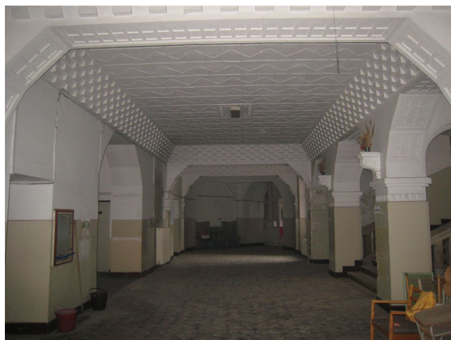
34. 1.n.p., vstupný vestibul, J pohľad.