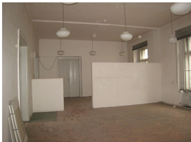
36. 1.n.p., J krídlo, m.č.1.36.