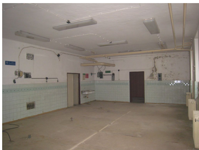
24. 1.p.p., S křídlo, m.č.0.19.