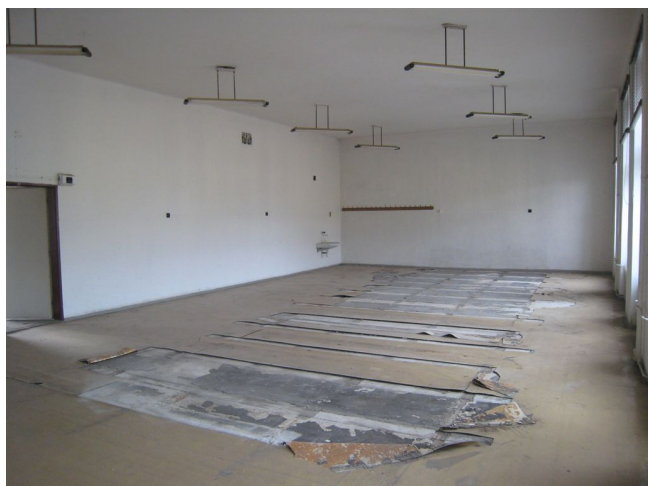
51. 2.n.p., m.č. 2.08.