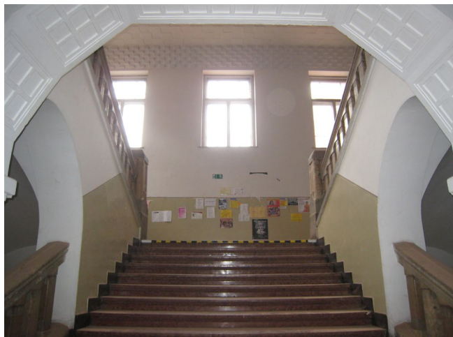
57. 2.n.p., pohľad na podestu schodiska z m.č.2.01.