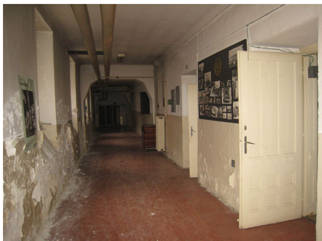
25. 1.p.p., chodba pod S krídlom, V pohľad.