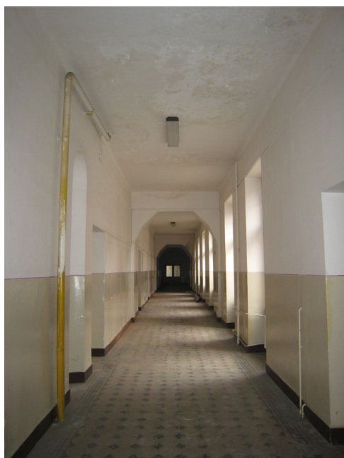
33. 1.n.p., chodba v S krídle, Z pohľad.