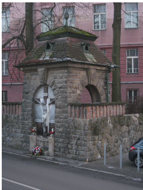
7. Letohrádok s reliéfom Ukrižovania.