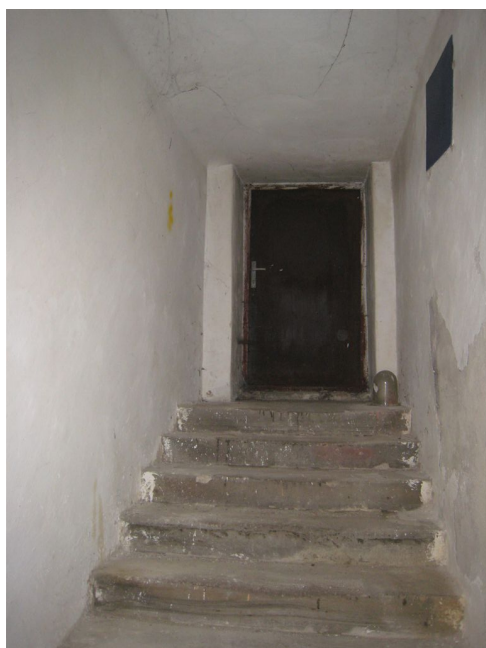
27. 1.p.p., schodisko na dvor, m.č.0.04.