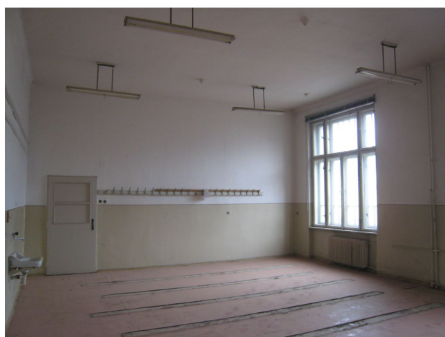
54. 2.n.p., m.č.2.14.