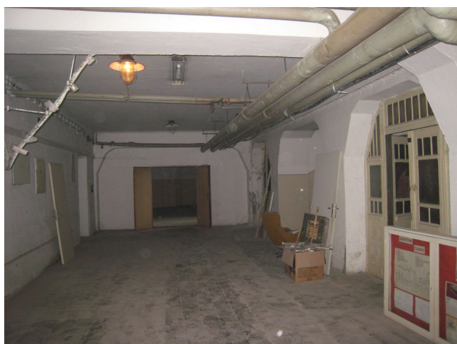
20. 1.p.p., m.č.0.01, čelné křídlo, J pohľad.