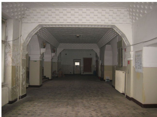
31. 1.n.p., vstupný vestibul, m.č.1.02, J pohľad.