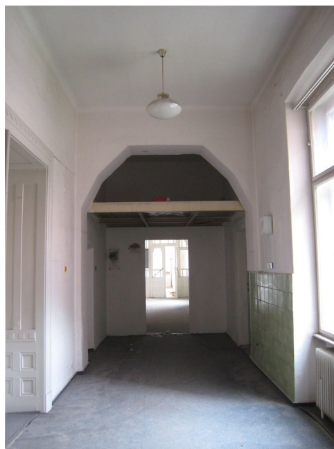
35. 1.n.p., chodba v J krídle, V pohľad.