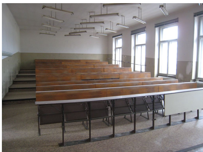
69. 3.n.p., m.č.3.07.