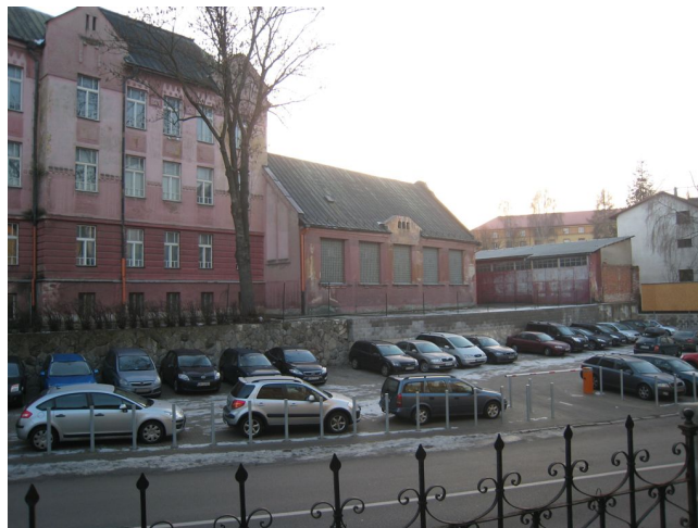
6. Fasáda krídla do ulice J.M. Hurbana, Z časť.