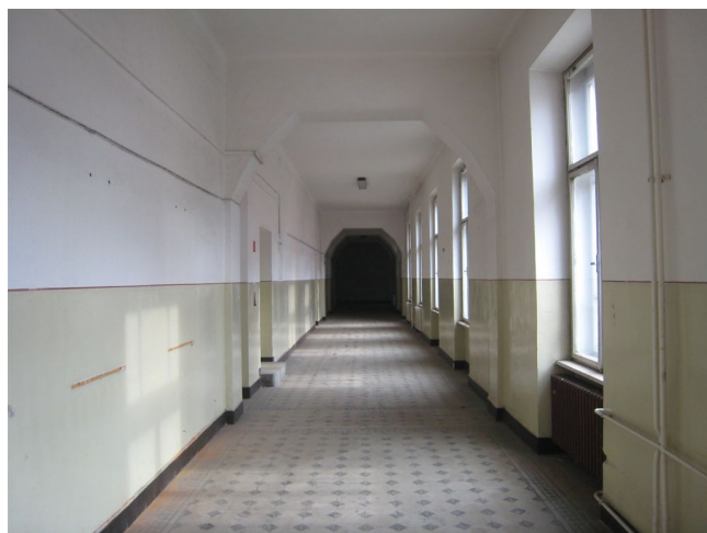
48. 2.n.p., chodba v S krídle, m.č.2.01, Z pohľad.