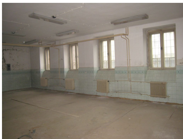
23. 1.p.p., S křídlo, m.č.0.19.