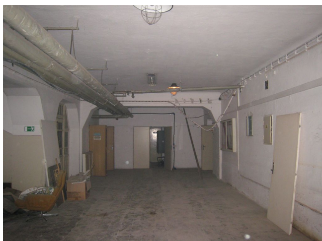
21. 1.p.p., m.č.0.01, čelné křídlo, S pohľad.