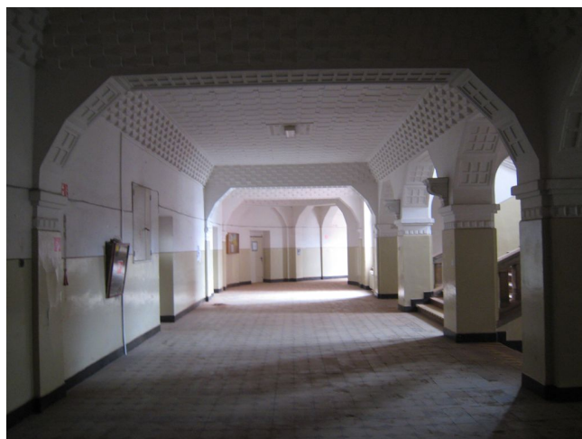
46. 2.n.p., schodisková hala, S pohľad.