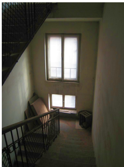
64. 3.n.p., schodisko v J křídle.