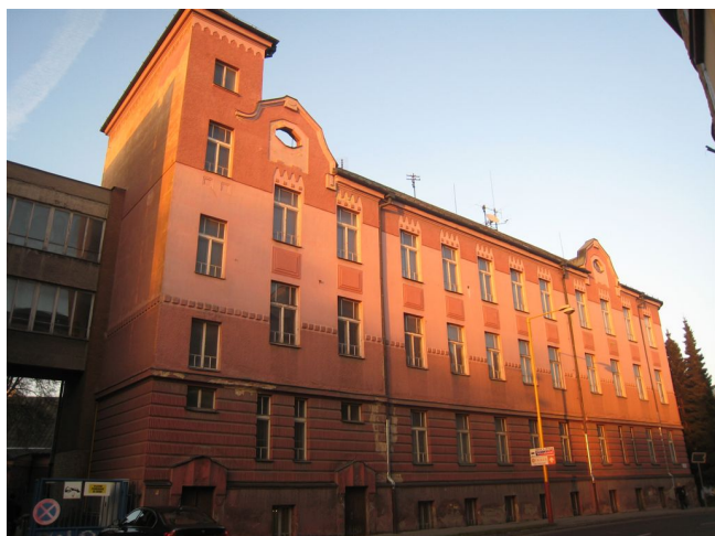
3. Fasáda do Legionárskej ulice, J pohľad.