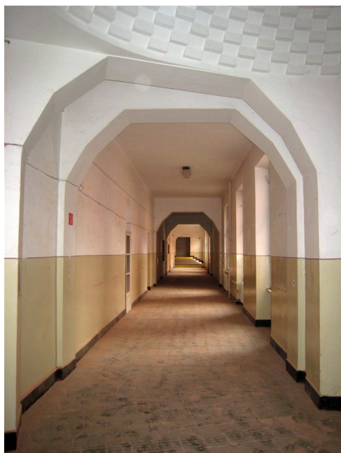
55. 2.n.p., chodba v J křídle, V pohľad.