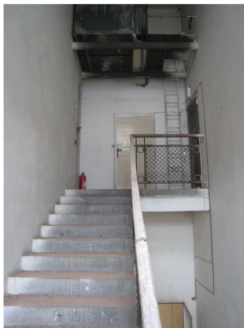
70. 4.n.p., schodisko v J krídle, vstupy do archívu a podkrovia.