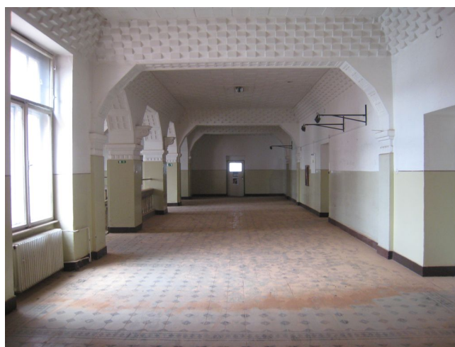
66. 3.n.p., schodisková hala, J pohľad.