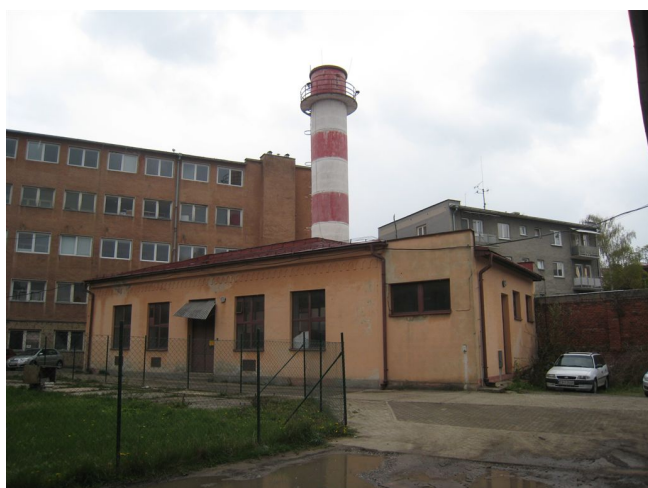
15. Zvyšok býv. domu školníka, nádvorie.