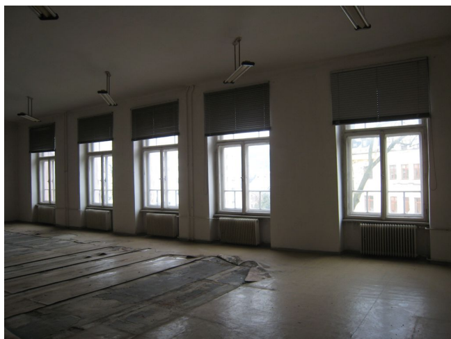
50. 2.n.p., m.č.2.08.