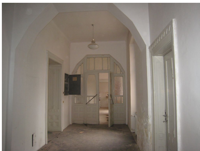
38. 1.n.p., J krídlo, priestor býv. bytu riaditeľa, J krídlo, V pohľad.