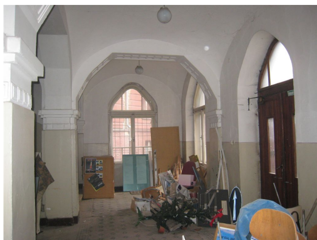
29. Vstup z dvora do schodiskového traktu, 1.n.p.