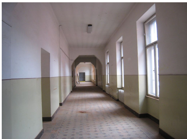
62. 3.n.p., chodba v J křídle, V pohľad.