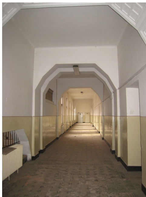
47. 2.n.p., chodba v S krídle, m.č. 2.01, V pohľad.