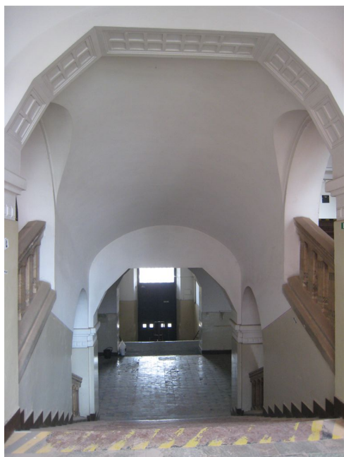
44. Pohľad na schodisko vstupného vestibulu z podesty hlavného schodiska, m.č.1.03.