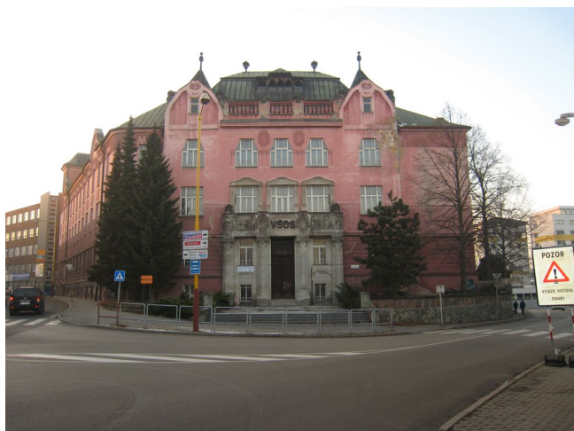
1. Čelná fasáda, V pohľad.