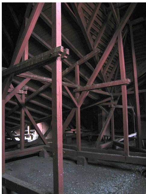
74. Podkrovie, konštrukcia krovu nad čelným krídlom.