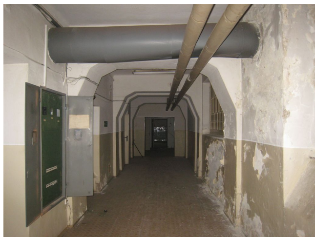
22. 1.p.p., chodba pod S křídlo, Z pohľad.