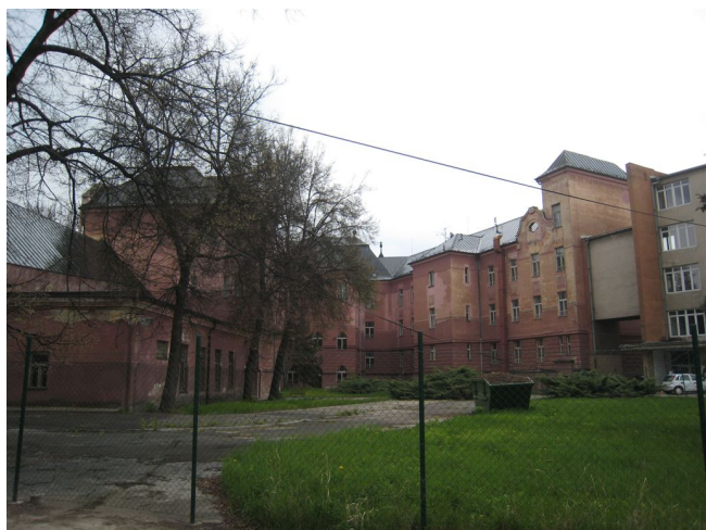
8. Dvorové fasády, Z pohľad.