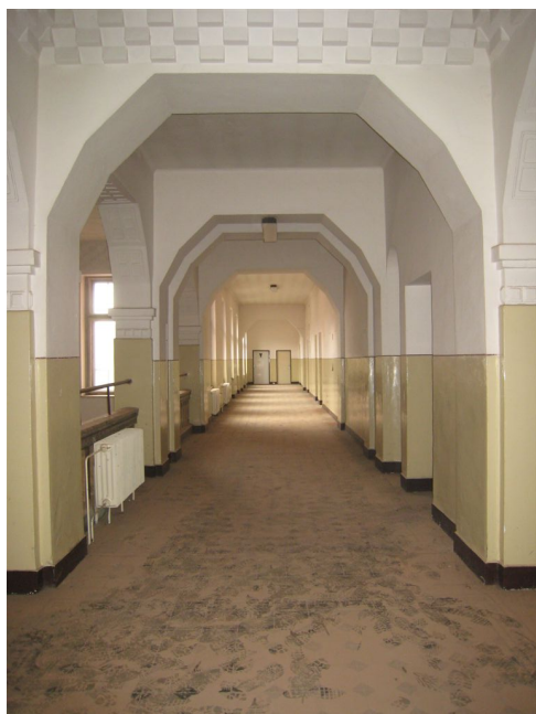
67. 3.n.p., chodba v S krídle, V pohľad.