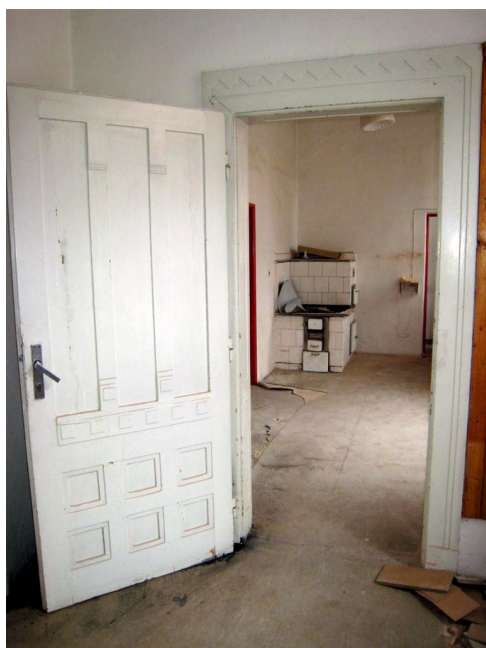
39. 1.n.p., J krídlo, priestor býv. kuchyne, m.č.1.46.