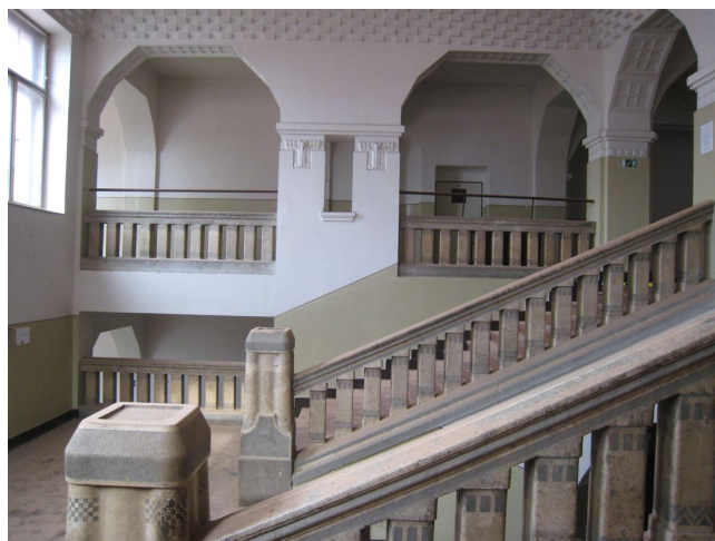
59. Schodisková hala, pohľad z juhu do S křídla.