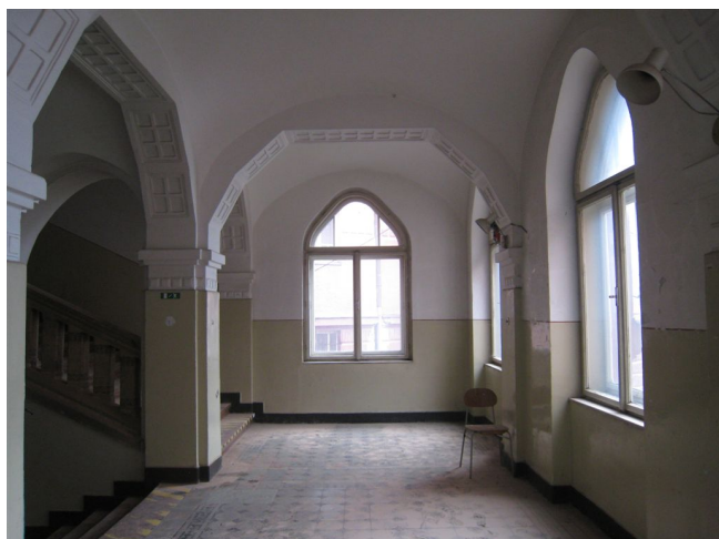
45. S pohľad na medzipodestu schodiska, m.č.1.03.