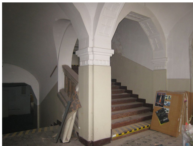
28. Podesta schodiska medzi 1.p.p. a 1.n.p.