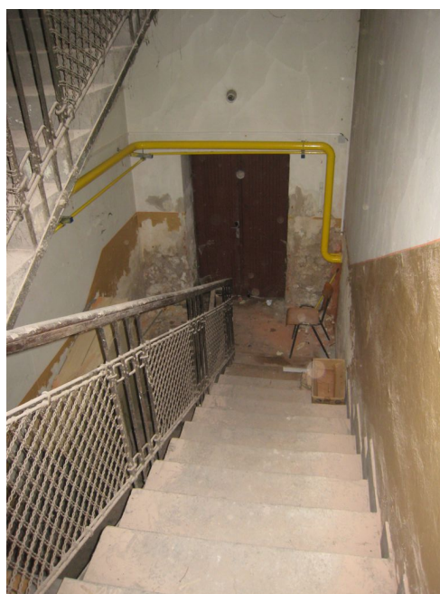
65. 1.n.p., schodisko v J křídle.