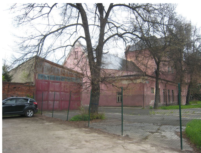
16. Dvorové fasády Z časti S krídla s prístavbou telocvične.