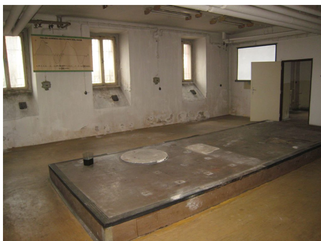
26. 1.p.p., S krídlo, m.č.0.09.