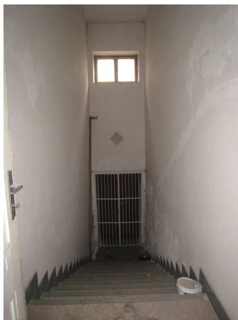
42. 1.n.p., schodisko do býv. bytu, J krídlo.