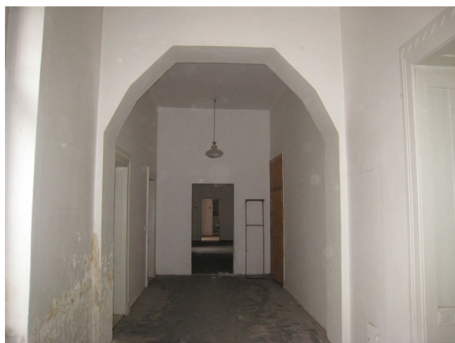
40. 1.n.p., J krídlo, Z pohľad, m.č.1.40.