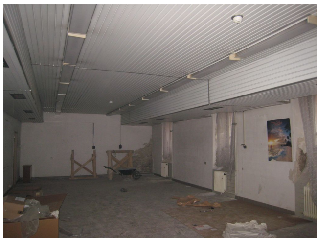
19. 1.p.p., m.č.0.28, J křídlo.