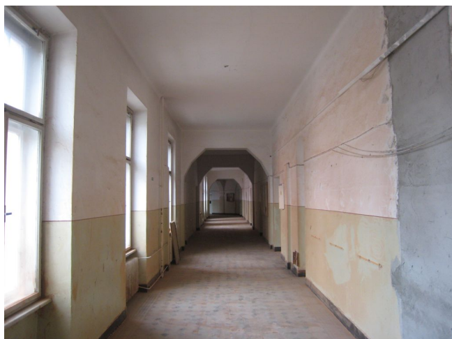
56. 2.n.p., chodba v J křídle, Z pohľad.