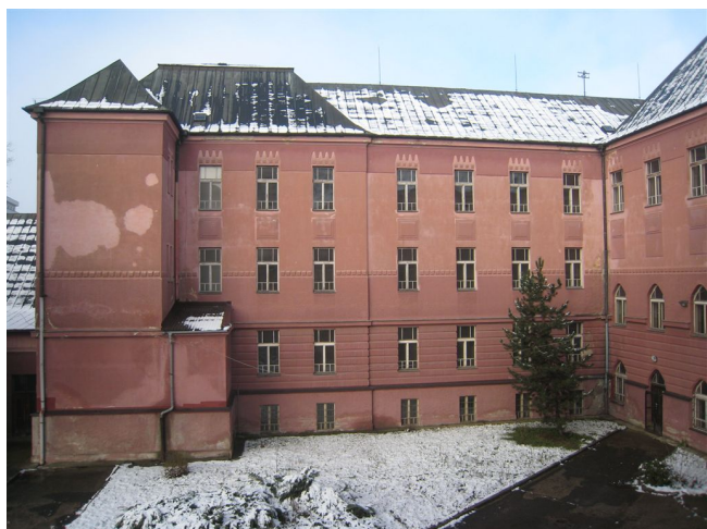
9. Dvorová fasáda S krídla hlavnej budovy.