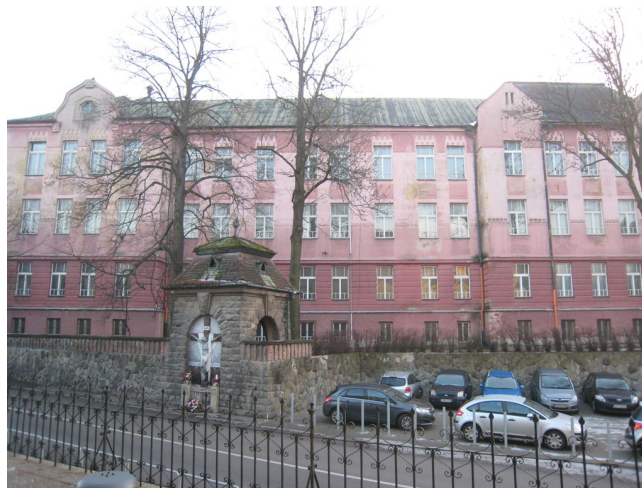
5. Fasáda krídla do ulice J.M. Hurbana, V časť.