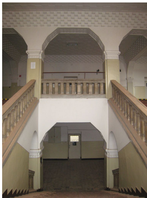
58. Podesta schodiska medzi 2. a 3.n.p.