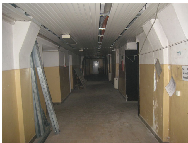
18. Chodba v 1.p.p. J krídla, V pohľad.