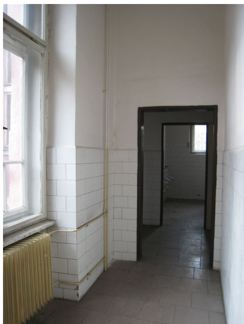
49. 2.n.p., záver chodby v S krídle.